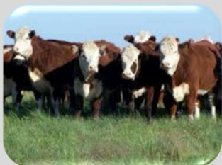
Novillo Gordo Campo

Se encuentran listadas las posiciones del mes corriente y los tres meses siguientes